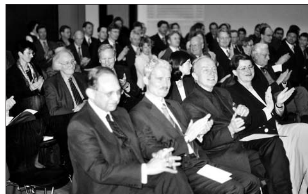
Mitgliederversammlung am 12. März 2003