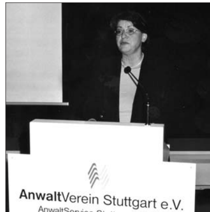
Corinna Werwig-Hertneck, Justizministerin des Landes Ba.-Wü.: Überfällige Gebührenanpassung muss kommen

sehe er, dass – obwohl bereits in der Vergangenheit bei der Justiz gespart worden sei – die Situation der öffentlichen Haushalte dazu führen könne, dass auch im richterlichen Bereich weiter gespart oder gar Stellen gestrichen würden. Hierfür bestehe praktisch kein Spielraum mehr.